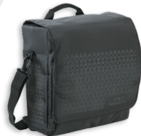
Melfort City Tasche 0252 RS | 35 x 34 x 16 | 15 l | 1420 g