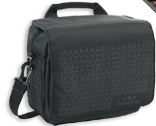
Taymore Lenkertasche 0251 RS | 26 x 22 x 13 | 6,5 l | 840 g