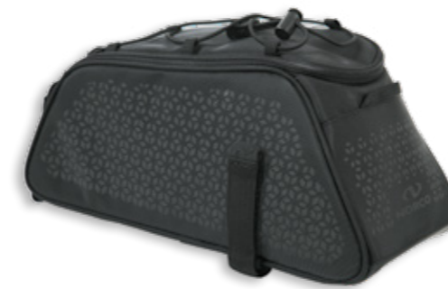
Dunfort Gepäckträgertasche 0254 RS | 34 x 17 x 16 | 7 l | 580 g