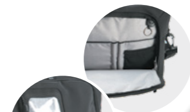
mit Smartphone- innentasche