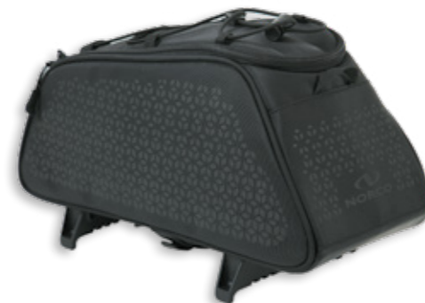
Dunfort Gepäckträgertasche Topclip 0254 TS | 34 x 17 x 16 | 7 l | 785 g