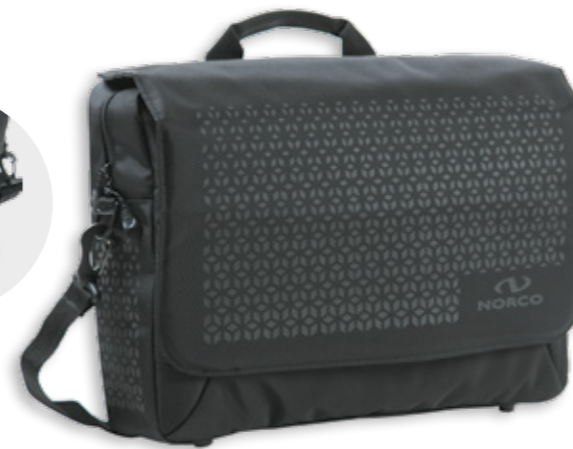
Kinross Commuter Tasche 0253 RS | 40 x 30 x 10 | 12 l | 1430 g